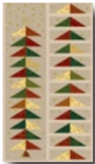
A: 4595-282 1 Panel